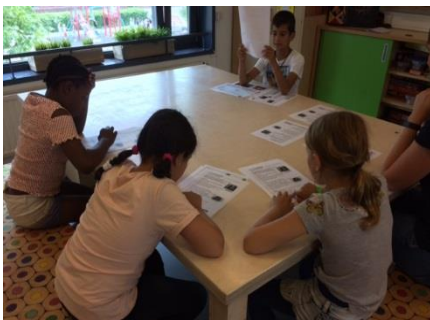
Groepje leerlingen ontvangt pre-teaching

Wekelijks komt er een dove NGT-docent op school, een 'Native Signer,' die de leerlingen lesgeeft in NGT en het CIDS-programma. CIDS is een psycho-educatie programma voor dove en slechthorende kinderen. Ook is er één dag een cluster 2 logopedist aanwezig. En er is een ambulante begeleider 7 dagdelen per week aanwezig. Zij werkt binnen en buiten de klas met de leerlingen. Zij begeleidt leerlingen bij o.a. begrijpend lezen, een vak waar veel SH/D kinderen moeilijkheden bij ondervinden. Leerlingen maken voor dit vak o.a. gebruik van het online leesprogramma Sprong Vooruit dat speciaal voor SH/D leerlingen ontwikkeld is. Daarnaast krijgen de leerlingen wekelijks, voorafgaand aan de klassikale Nieuwsbegriples, pre-teaching van Nieuwsbegrip. Zo kunnen de kinderen effectiever deelnemen aan de klassikale les. In het pre-teachingsgroepje kunnen naast de SH/D leerling ook andere, horende, klasgenoten meedraaien die zwak zijn in taal of het Nederlands nog niet goed beheersen.