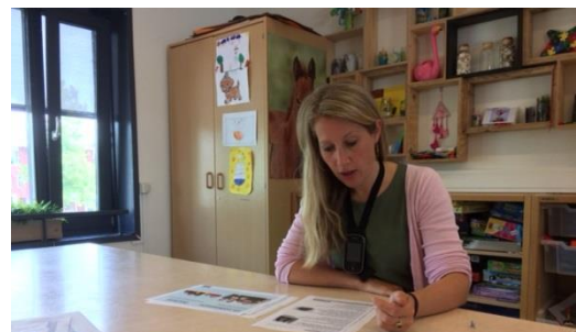
Ambulante begeleider met soloapparatuur

Hoe komen de leerlingen naar school? Dat verschilt per leerling. Er is een leerling die dagelijks wordt gebracht door zijn ouders, er zijn leerlingen die in de buurt van de school wonen en er zijn leerlingen die met de taxi naar school komen. Als de ouders niet in de gelegenheid zijn om hun kind zelf te brengen, is het mogelijk om met een vervoersverklaring een taxi via de gemeente van de woonplaats van het kind aan te vragen.