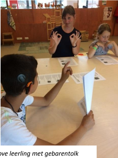
Dove leerling met gebarentolk

De SH/D leerlingen die nu op de Kleine Dichter zitten, komen zowel van Auris Rotsoord, als Auris Fortaal als van een reguliere school.