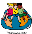
We horen bij elkaar

Alle groepen van de school starten met de lessen uit Blok 1, 'we horen bij elkaar.' Tijdens dit blok staat het samen werken aan een positief werkklimaat centraal. Naast de algemeen geldende schoolregels maken leerkracht en kinderen samen afspraken over hoe je met elkaar omgaat en over de inrichting en het ordelijk houden van de klas.